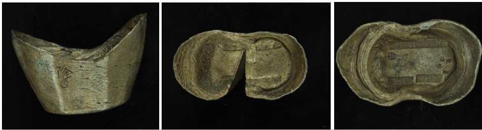
ภาพที่ ๓ - ๕ เงินไซซีเรือสำเภา

เงินไซซีทำโดยการหล่อจากแม่พิมพ์ให้มีรูปร่างตามต้องการ และขณะที่โลหะทองคำหรือเงินยังแข็งตัวไม่เต็มที่จะตีตราอักษรจีนตอกประทับทั้งด้านหน้าและด้านหลังเพื่อบอกชื่อเมืองที่ผลิต ชื่อผู้ออกเงิน และข้อความอื่น ๆ เงินไซซีไม่มีราคาหน้าเหรียญเพราะเป็นแท่งเงินที่กำหนดค่าโดยน้ำหนักและเนื้อเงิน โดยใช้มาตรฐานตำลึงเงิน (๒.๕๐ บาท หรือสิบสลึงเท่ากับหนึ่งตำลึงเงิน) ๕ น้ำหนักและเนื้อเงินของเงินไซซีอาจแตกต่างกันไปขึ้นอยู่กับแหล่งที่ทำ จึงไม่จำเป็นที่เงินไซซีจะต้องทำจากเนื้อเงินบริสุทธิ์เสมอไป เงินไซซีที่พบมากที่สุด คือ เงินไซซีรองเท้า (Shoe money) ซึ่งมีลักษณะคล้ายรองเท้าของสตรีจีนที่นิยมสวมใส่ในสมัยโบราณ นอกจากนี้ก็มีเงินไซซีอานม้า (Saddle money) เงินไซซีเรือสำเภา (Boat money) บ้างก็ทำเป็นรูปร่างตามจินตนาการต่าง ๆ ของผู้ทำเงิน เช่น รูปปลา รูปผีเสื้อ รูปใบไม้ เป็นต้น เมื่อต้องการใช้เงินปลีกย่อยก็จะตัดเงินไซซีออกเป็นส่วนย่อย ๆ ตามน้ำหนักที่ต้องการ ๖