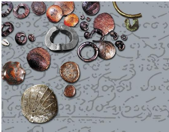
ภาพที่ ๒ เงินตราล้านนา

อาณาจักรล้านนาได้ผลิตเงินตรามาตรฐานขึ้นใช้ในระบบเศรษฐกิจสำหรับซื้อขายจ่ายทอง เพื่อการค้าขายของประชาชนในท้องถิ่น และเพื่อการค้ำระหว่างอาณาจักร รูปแบบของเงินตราล้านนาได้ผ่านความคิดสร้างสรรค์ พัฒนาจนเกิดเป็นมาตรฐานและเป็นเอกลักษณ์ เช่น เงินกำไล เงินเจียง เงินดอกไม้ และเงินธูป นอกจากนี้เงินตราท้องถิ่นของอาณาจักรล้านนาแล้วยังพบเงินตราของชนชาติต่าง ๆ หลายชนิดในดินแดนของอาณาจักรล้านนา โดยเงินตราท้องถิ่นเหล่านี้ช่วยสะท้อนให้เห็นความสำคัญของอาณาจักรล้านนาในฐานะจุดศูนย์กลางทางการค้าที่สำคัญของแผ่นดินตอนใน นอกจากนี้ยังมีเงินตราอีกชนิดหนึ่งซึ่งถึงแม้จะไม่ใช่เงินที่ทำขึ้นในท้องถิ่นนั้นแต่ก็ได้รับการยอมรับและใช้เป็นสื่อกลางในการค้าขายในอาณาจักรล้านนาเป็นเวลานานมาแล้ว เงินชนิดนี้มีแหล่งกำเนิดจากประเทศจีนรู้จักกันในนามของ “เงินไซซี”