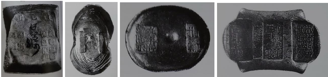
ภาพที่ ๑๔ - ๑๗ เงินไซซีแบบต่าง ๆ ที่พบในประเทศจีน

สินค้าที่มีมูลค่าสูง และจ่ายเป็นค่าภาษี ๙ หลังจากเกิดกบฏไท่ผิง (Taiping rebellion) ขึ้น เมื่อประมาณ พ.ศ. ๒๓๙๔ - ๒๔๐๔ ชาวตะวันตกเพิ่มความสนใจที่จะทำการค้ากับชาวจีนมากขึ้นถึงขนาดผลิตเหรียญดอลลาร์เงินสำหรับใช้ในการค้าขายกับประเทศจีนและบีบบังคับให้รัฐบาลจีนผลิตเหรียญกษาปณ์แบบมาตรฐานตะวันตกออกใช้และเนื่องจากรัฐบาลกลางของประเทศจีนในขณะนั้นขาดเสถียรภาพทำให้มีผลต่าง ๆ ในประเทศจีนต่างก็ตั้งโรงกษาปณ์และผลิตเหรียญดอลลาร์และเงินเซนต์ขึ้นใช้เองโดยมีขนาดและมาตรฐานของเหรียญแตกต่างกันไป ในช่วงต้นคริสต์ทศวรรษที่ ๒๐ ประเทศจีนมีเงินตราหลักที่ใช้ในประเทศอยู่ ๓ ชนิด ได้แก่ เหรียญกษาปณ์แบบตะวันตก ธนบัตรและเงินไซซีที่ออกโดยพ่อค้าและธนาคาร และเงินเหรียญ cash coin เงินเหรียญดั้งเดิมที่ใช้ติดต่อกันมาช้านาน เงินไซซีและธนบัตรที่ออกโดยพ่อค้าเริ่มเสื่อมความนิยมลงเมื่อประเทศจีนเปลี่ยนแปลงการปกครองเป็นแบบสาธารณรัฐใน พ.ศ. ๒๔๕๗ และได้ออกเหรียญดอลลาร์จีนหรือที่เรียกว่าเงินหยวน (yuan) ออกใช้ ซึ่งได้รับการยอมรับจากประชาชนเป็นอย่างดี ในพ.ศ. ๒๔๗๘ รัฐบาลจีนได้ประกาศเลิกใช้ไซซีไปในที่สุด ๑๐