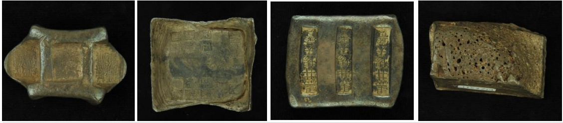
ภาพที่ ๑๐ - ๑๓ เงินไซซีแบบอื่น ๆ ที่พบในประเทศไทย