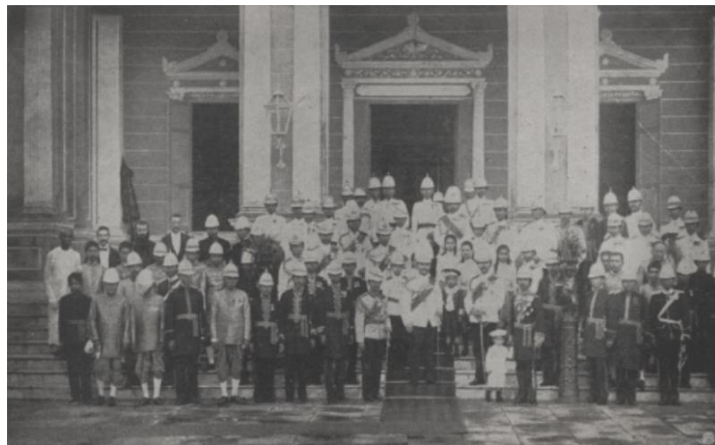
ทรงฉายพระรูปหมู่ที่พระราชวังบางปะอิน เมื่อคราวเสด็จประพาสหัวเมืองฝ่ายเหนือ พ.ศ. ๒๔๔๔

ในสมัยรัตนโกสินทร์พระบาทสมเด็จพระจอมเกล้าเจ้าอยู่หัว รัชกาลที่ ๔ ทรงริเริ่มเสด็จประพาสหัวเมืองฝ่ายเหนือเป็นพระองค์แรก ๑ เพื่อทรงเยี่ยมราษฎรและตรวจราชการตามหัวเมืองไกล ๆ ในพระราชอาณาเขต ต่อมาเมื่อ พ.ศ. ๒๔๔๔ (ร.ศ. ๑๒๐) พระบาทสมเด็จพระจุลจอมเกล้าเจ้าอยู่หัว รัชกาลที่ ๕ ทรงมีพระบรมราโชบายตามแบบอย่างพระราชบิดา ในการเสด็จประพาสหัวเมืองฝ่ายเหนือเพื่อสำรวจความเป็นไปในแต่ละหัวเมือง ทั้งชีวิตความเป็นอยู่ของราษฎร ปัญหาต่าง ๆ และการปฏิบัติหน้าที่ของข้าราชการ โดยพระองค์มีพระราชประสงค์ในการพระราชทานสิ่งของเพื่อเป็นที่ระลึกในการเสด็จประพาสหัวเมืองในครั้งนี้ด้วย