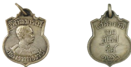
ภาพถ่าย: เหรียญเสมาที่ระลึกเสด็จกลับจากยุโรป ร.ศ. ๑๒๖ ชนิดเงิน

ด้านบนมีห่วงกลม ด้านหน้า เป็นพระบรมรูปพระบาทสมเด็จพระจุลจอมเกล้าเจ้าอยู่หัวครึ่งพระองค์ ผินพระพักตร์ไปทางขวาของเหรียญทรงเครื่องยศทหารมหาดเล็กและมีพระปรมาภิไธยอยู่เบื้องบน “จุฬาลงกรณ์” เบื้องล่าง “บรมราชาธิราช” ริมพระอังสาด้านขวามีข้อความว่า “A.PATEY” ด้านหลัง มีข้อความว่า “เสด็จกลับจากยุโรป โดยมีตัวเลข ๔๐ อยู่บน รศ ๑๒๖” ผู้ออกแบบเหรียญ คือ August Patey