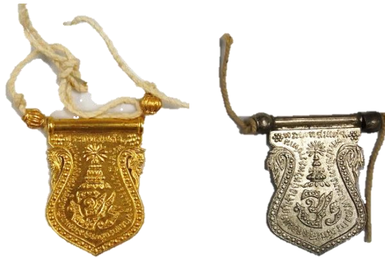
เหรียญเสมาที่ระลึก จปร แบบมีลูกคั่น ชนิดทองคำ และชนิดเงิน

สำหรับเหรียญเสมาที่ระลึก จปร ทองคำ พระบาทสมเด็จพระจุลจอมเกล้าเจ้าอยู่หัวทรงพระกรุณาโปรดเกล้าฯ ให้สร้างขึ้นเพื่อพระราชทานให้หม่อมเจ้าและบุตรข้าราชการผู้ใหญ่ที่ตามเสด็จประพาสมณฑลฝ่ายเหนือด้วย