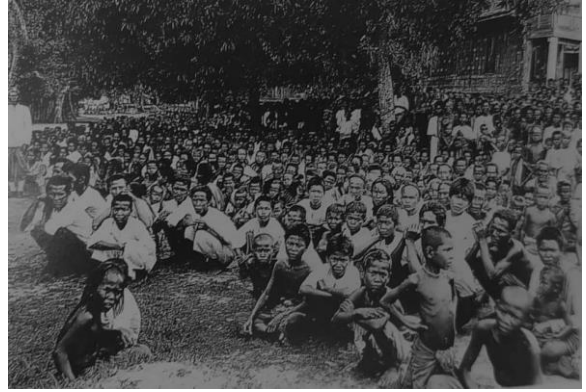
ภาพถ่าย: พระบาทสมเด็จพระจุลจอมเกล้าเจ้าอยู่หัวทรงพระราชทานเสมาแก่เด็ก เมื่อคราวเสด็จประพาสมณฑลฝ่ายเหนือ ภาพขาว: ราษฎรเฝ้ารับเสด็จฯ ที่วัดป่าโมกข์ เมืองอ่างทอง

เหรียญเสมาที่ระลึก จปร เป็นเหรียญที่พระบาทสมเด็จพระจุลจอมเกล้าเจ้าอยู่หัวทรงพระกรุณาโปรดเกล้าฯ ให้สร้างขึ้นเพื่อสำหรับพระราชทานเป็นของขวัญแก่เด็กชายและเด็กหญิงที่มาเฝ้ารับเสด็จตามสถานที่ต่าง ๆ ขณะพระองค์เสด็จพระราชดำเนินประพาสมณฑลหัวเมืองฝ่ายเหนือ ซึ่งแสดงให้เห็นถึงความรัก ความเมตตาคุณานที่พระองค์ทรงมีต่อราษฎรอย่างแท้จริง สำหรับการพระราชทานเหรียญเสมาที่ระลึกให้แก่เด็กเริ่มเมื่อวันที่ ๕ ตุลาคม พ.ศ. ๒๔๔๔ ณ พลับพลารับเสด็จที่เมืองชัยนาท ๓ และจนตลอดหนทางที่เสด็จพระราชดำเนินตามสถานที่และเมืองต่าง ๆ เหล่าบรรดาราษฎรจะพาบบุตรหลานมาคอยเข้าเฝ้ารับเพื่อรับพระราชทานเหรียญเสมาที่ระลึกจากพระหัตถ์