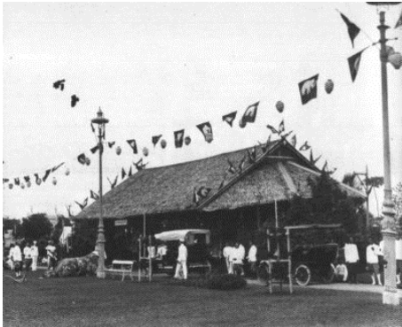
ศาลาอันเตปรุริณในสมัยรัชกาลที่ ๕

การจัดงานรับเสด็จบรรดาพระบรมวงศานุวงศ์ ข้าราชการบริพาร ข้าราชการ และพ่อค้าต่าง ๆ ได้จัดสร้างซุ้มรับเสด็จที่ยิ่งใหญ่อลังการและประดับตกแต่งเส้นทางที่จะเสด็จราชดำเนินไว้อย่างสวยงาม ถนนหนทางก็เต็มไปด้วยราษฎรที่พากันหลาณาเข้ามารับเสด็จเป็นจำนวนมาก ในการนี้ทรงพระกรุณาโปรดเกล้าฯ ให้เจ้าพนักงานแจกเหรียญเสมาเป็นที่ระลึกให้แก่เด็กและราษฎรที่มารับเสด็จตั้งแต่ท้องสนามหลวงตลอดถนนราชดำเนินนอก