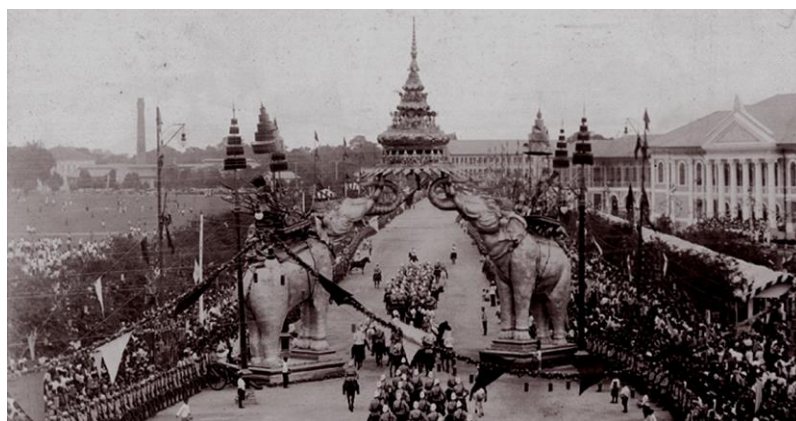
ภาพงานรับเสด็จรัชกาลที่ ๕ หลังจากเสด็จกลับจากยุโรป ครั้งที่ ๒ (ชุมนุมมยุทธนาธิการ)

ในการเสด็จพระราชดำเนินกลับพระนครพระบาทสมเด็จพระจุลจอมเกล้าเจ้าอยู่หัวทรงพระกรุณาโปรดเกล้าฯ พระราชทานของฝากรวมถึงเหรียญเสมาแก่บุตรหลานผู้ที่มารับเสด็จ ดั่งหม่อมเจ้าพูนพิศมัยได้กล่าวไว้ว่า “...เรือออกข้ามทะเลไปเมืองจันทบุรี และเมืองตราด ซึ่งได้คืนมาจากคติ ร.ศ. ๑๑๒ ใหม่ ๆ แล้วจึงเสด็จกลับกรุงเทพมหานคร ในระยะทางกลางทะเลนั้น พระบาทสมเด็จพระจุลจอมเกล้าเจ้าอยู่หัวพระราชทานของฝากแก่ผู้ไปรับเสด็จแทบทุกคน ข้าพเจ้าและหญิงเหลือ ก็ได้รับพระราชทานเสมา ทรงผูกพระราชทานเอง...” ๙