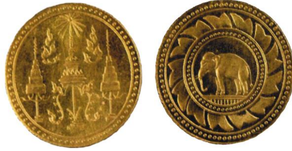
ภาพเหรียญทองตราพระมหามงกุฏ-พระแสงจักร