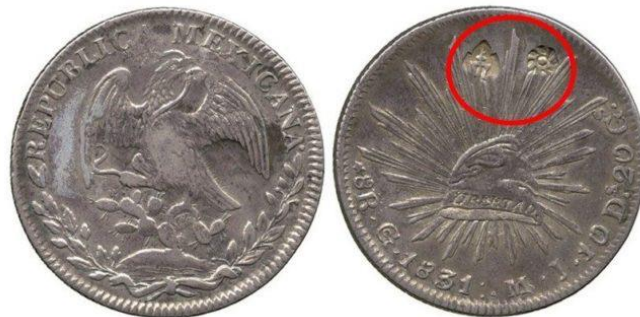
ภาพเหรียญเงินเม็กซิกันที่มีการตอกตราพระมหามงกุฏและตราจักร

๑. เหรียญเงินเม็กซิกัน เป็นเหรียญตราทำด้วยเงิน ด้านหนึ่งเป็นรูปนกอินทรีกางปีกกำลังคาบงู ยืนอยู่บนต้นกระบองเพชร รายล้อมด้วยช่อใบไม้ ด้านบนเป็นอักษร “REPUBLICA MEXICANA” อีกด้านหนึ่งเป็นรูปหมวกแห่งเสรีภาพ มีการระบุราคา ปีที่ผลิต และโรงกษาปณ์ที่ผลิต ผลิตในช่วงพ.ศ. ๒๓๖๖ – ๒๔๔๐ นำมาใช้ในไทยในช่วงรัชกาลที่ ๓ – ๕ ๖ โดยพบเหรียญชนิดนี้บางส่วนมีการตอกตราพระมหามงกุฏและตราจักรซึ่งมีการระบุถึงการตอกตราไว้ในประกาศห้ามไม่ให้เอาทองเหรียญเงินเหรียญแต่งตัวให้เด็กและอนุญาตให้ใช้เงินเหรียญนอก พ.ศ. ๒๔๐๐ ว่า “ราษฎรไม่เชื่อเนื้อเงินเหรียญก็จะตราอย่างตราเงินบาทลงในแผ่นเงินเหรียญมาให้เป็นสำคัญ ให้ราษฎรเชื่อว่าเป็นเนื้อเงินดี” จากรูปแบบเหรียญที่ด้านหนึ่งเป็นรูปนกอินทรีจึงเชื่อว่าเป็นเหรียญนก ตามในประกาศปิดเงินเหรียญนอกที่ได้กำหนดปิดการค้าแลกเปลี่ยนไว้ที่ ๓ เหรียญนกเป็นเงิน ๕ บาท