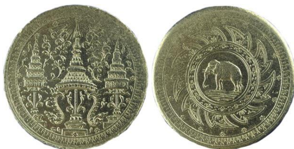
ภาพเหรียญเงินพระมหามงกุฎ – พระแสงจักรที่ผลิตขึ้นจากเครื่องจักรที่สั่งซื้อจากประเทศอังกฤษ

“...กำหนดเหรียญอย่างไทยเหรียญบาทแปะเงินแล้ว มีเงินแปะๆ ละสองสลึงบ้าง สลึงบ้าง เฟื้องบ้าง ในเงินเหรียญเงินแปะเหล่านี้ หน้าหนึ่งมีตรารูปพระมหากษัตริย์มงกุฎอยู่กลาง มีฉัตรกระหนาบอยู่สองข้าง มีกึ่งไม้แปะเปลวแซกอยู่ในท้องลาย หน้าหนึ่งเป็นรูปจักร กลางใจจักรมีรูปช้างประจำแผ่นดิน รอบวงจักรชั้นนอกเหรียญบาทมีดาวอยู่แปดทิศคือบอกว่าแปดเฟื้อง แปะสองสลึงมีดาวอยู่สี่ทิศคือบอกว่าสี่เฟื้อง แปะสลึงมีดาวอยู่ข้างบนข้างล่างสองดาวคือบอกว่าสองเฟื้อง แปะเฟื้องมีดาวอยู่ข้างบนดาวเดียวแปลว่าเฟื้องเดียว...”