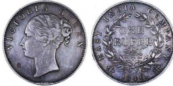
ภาพเหรียญรูปีอินเดีย

๒. เหรียญรูปีอินเดีย เป็นเหรียญตราทำด้วยเงิน ด้านหนึ่งเป็นภาพกษัตริย์อังกฤษและพระนาม อีกด้านหนึ่งมีข้อความระบุมูลค่าเหรียญ ถูกใช้อย่างแพร่หลายในช่วงรัชกาลที่ ๔ – ๕ ๑๐ สันนิษฐานว่าเป็น เหรียญรูปีเมืองอินเดีย ตามในประกาศพิกัตเงินเหรียญนอกที่ได้กำหนดพิกัตการแลกเปลี่ยนไว้ที่ ๗ รูปี เป็นเงิน ๕ บาท