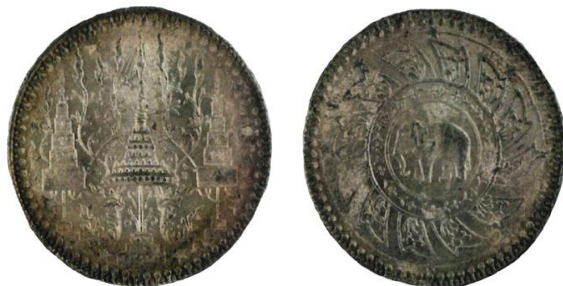
ภาพเหรียญบรรณาการ

โดยมีการผลิตเหรียญเงินจากเครื่องจักรดังกล่าวจำนวนหนึ่ง เนื่องจากเป็นเครื่องจักรที่ใช้แรงคน โดยเรียกเหรียญในชุดนี้ว่า “เหรียญบรรณาการ” ด้านหน้าเป็นรูปพระมหามงกุฎเปล่งรัศมี มีฉัตรขนานสองข้าง พื้นเป็นลายกึ่งไม้ รอบวงขอบมีดาว โดยดาวดวงหนึ่งแทนราคา ๑ เฟื้อง อีกด้านหนึ่งเป็นรูปช้างยืนอยู่กลางจักร รอบวงขอบชั้นนอกมีดาวบอกราคา จำนวนเท่ากับด้านหน้า ๑๒