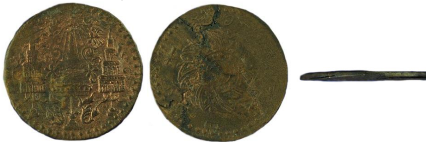
เหรียญทองแดงตราพระมหามงกุฏ - พระแสงจักร แบบบาง