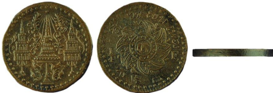
เหรียญทองแดงตราพระมหามงกุฏ - พระแสงจักร แบบหนา

นอกจากนี้ยังได้มีการผลิตเหรียญทองแดงเพิ่มเติมในพ.ศ. ๒๔๐๘ โดยมีตราเหมือนกับเหรียญตีบุกอัฐและโสฬส เหรียญใหญ่เรียกว่า ชีก ให้ ๒ ชีกมีค่า ๑ เฟื้อง และเหรียญเล็กเรียกว่า เสี้ยว ให้ ๔ เสี้ยวมีค่า ๑ เฟื้อง ๒๐ ในพ.ศ. ๒๔๐๙ ได้มีการผลิตเหรียญทองแดงให้บางลง เนื่องจากในเหรียญมีข้อความบอกไว้แล้วว่า ๒ อันเฟื้อง และ ๔ อันเฟื้อง ๒๑