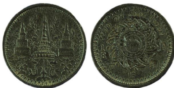
เหรียญดีบุกตราพระมหามงกุฎ – พระจักร

โดยได้กำหนดหน่วยเงินขึ้นใหม่ ได้แก่ อัฐ และ โสฬส กำหนดค่าให้ ๘ อัฐเป็น ๑ เฟื้อง และ ๑๖ โสฬสเป็น ๑ เฟื้อง ๑๖