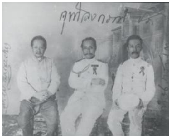
พระบาทสมเด็จพระจุลจอมเกล้าเจ้าอยู่หัว พระเจ้าน้องยาเธอ กรมหลวงเทวะวงศวิโรภการ และพระเจ้าน้องยาเธอ กรมหมื่นดำรงราชานุภาพ

สวีเดน นอร์เวย์ (ปัจจุบันแยกเป็นประเทศนอร์เวย์ และประเทศสวีเดน) เดนมาร์ก อังกฤษ เบลเยียม เยอรมัน เนเธอร์แลนด์ ฝรั่งเศส สเปน และโปรตุเกส เพื่อทอดพระเนตรการบริหารบ้านเมือง และนำมาปรับปรุงพัฒนาประเทศให้เจริญก้าวหน้า พร้อมทั้งเป็นการสร้างสัมพันธ์ไมตรีอันดีกับประเทศตะวันตกเพื่อลดความตึงเครียดทางการเมือง การเตรียมการที่สำคัญประการหนึ่งในการเสด็จประพาสยุโรป พ.ศ. ๒๔๔๐ คือ การแต่งตั้งผู้สำเร็จราชการแผ่นดิน