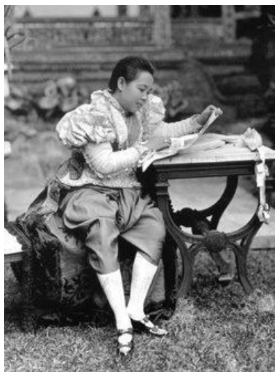
สมเด็จพระนางเจ้าเสาวภาผ่องศรี พระบรมราชินีนาถ

การเสด็จประพาสต่างประเทศครั้งนี้เป็นครั้งแรกที่พระมหากษัตริย์ไทยต้องประทับอยู่นอกพระราชอาณาจักรเป็นเวลายาวนานถึง ๘ เดือนเศษ พระองค์จึงทรงพระกรุณาโปรดเกล้าฯ แต่งตั้งให้สมเด็จพระนางเจ้าเสาวภาผ่องศรี พระอรรคราชเทวี ทรงดำรงตำแหน่งผู้สำเร็จราชการแทนพระองค์ และเฉลิมพระนามาภิไธยเป็น “สมเด็จพระนางเจ้าเสาวภาผ่องศรี พระบรมราชินีนาถ” และทรงพระกรุณาโปรดเกล้าฯ ให้จัดการพระราชพิธีสมโภชสิริสถาปนาพระบรมราชตำริและพระราชกำหนด เพื่อมอบราชกิจการปกครองพระนครเมื่อวันที่ ๒๐ มีนาคม ๒๔๓๙ ณ พระที่นั่งไพศาลทักษิณ