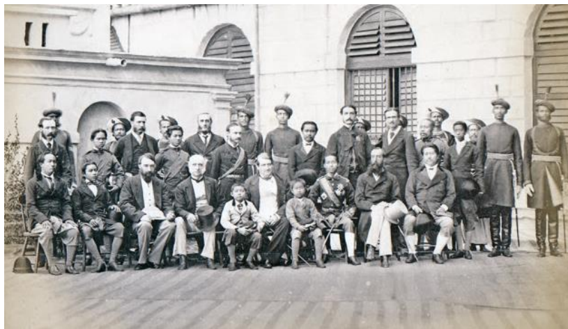
พระบาทสมเด็จพระจุลจอมเกล้าเจ้าอยู่หัว กับคณะชาวอังกฤษขณะเสด็จฯ เยือนอินเดีย

ในช่วงต้นรัชกาล พระบาทสมเด็จพระจุลจอมเกล้าเจ้าอยู่หัวได้เสด็จพระราชดำเนินเยือนประเทศต่าง ๆ ในภูมิภาคเอเชียที่ตกเป็นอาณานิคมของต่างชาติ ได้แก่ การเสด็จประพาสสิงคโปร์ อินเดีย พม่าซึ่งเป็นอาณานิคมของอังกฤษ ปัตตาเวีย สมารัง ซวา ซึ่งเป็นอาณานิคมของฮอลันดาหรือเนเธอร์แลนด์ การเสด็จประพาสในช่วงต้นรัชกาลนี้เป็นโอกาสสำคัญที่พระองค์ได้ทอดพระเนตรพัฒนาทางกายภาพและวิธีการบริหารบ้านเมือง ตลอดจนความก้าวหน้าของประเทศเหล่านั้น อันเป็นแนวทางให้พระองค์ทรงดำเนินการปฏิรูปบ้านเมืองและเป็นการเตรียมขบวนเดินทางในการเสด็จประพาสยุโรป ๑