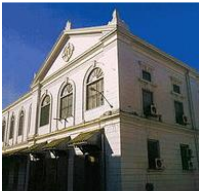
ภาพที่ ๕ อาคารสำนักบริหารเงินตรา (กองคลังกลางเดิม) ในพระบรมมหาราชวัง

กรมธนารักษ์ได้รับสนองนโยบายของคณะรัฐมนตรี และพิจารณาเห็นว่า อาคารสำนักบริหารเงินตรา (กองคลังกลางเดิม) ในพระบรมมหาราชวังชำรุด เนื่องจากโครงสร้างอาคารรับน้ำหนักมากเกินไป และที่สำคัญอาคารห้องมั่นคง ๓ ชั้น เกิดการทรุดตัวลงและตัวอาคารมีรอยแตกร้าวอยู่ทั่วไป เนื่องจากต้องรับน้ำหนักเหรียญกษาปณ์ที่เก็บรักษาไว้ในกิจกรรมการรักษาเงินคงคลังและการรักษาเหรียญกษาปณ์หมุนเวียนที่เพิ่มขึ้นเรื่อยๆ ประกอบกับอาคารมีอายุการใช้งานมากกว่า ๑๐๐ ปี ทำให้วัสดุที่ใช้ก่อสร้างเสื่อมคุณภาพความมั่นคงแข็งแรงจึงลดลงด้วย ๔