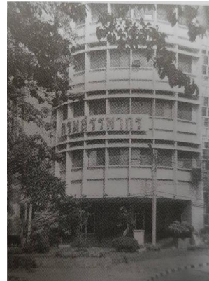
ภาพที่ ๒ (ซ้าย) อาคารกรมธนารักษ์ (ขวา) อาคารกรมสรรพากร

อาคารที่ทำการของกรมธนารักษ์ตั้งอยู่ทางทิศเหนือ ด้านวัดชนะสงคราม ประกอบด้วยอาคาร ๒ หลัง สูง ๓ ชั้นและ ๒ ชั้น เชื่อมต่อกัน เป็นที่ทำการของหน่วยราชการภายในกรมธนารักษ์ ได้แก่ สำนักเลขานุการกรม กองคลัง กองจัดประโยชน์ กองที่ราชพัสดุ กองนิติการ และกองแบบแผนและการก่อสร้าง โดยใช้เป็นที่ทำการมาตั้งแต่ พ.ศ.๒๕๐๓ ก่อนจะย้ายที่ทำการมาอยู่ในกระทรวงการคลัง ถนนพระรามที่ ๖ ใน พ.ศ. ๒๕๓๕