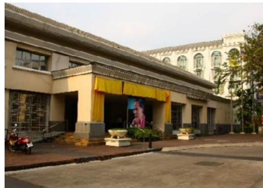
ภาพที่ ๗ อาคารสำนักบริหารเงินตรา (เดิม)

แต่เนื่องด้วยตัวอาคารได้รับการออกแบบสำหรับใช้เป็นพิพิธภัณฑ์ จึงมิได้จัดสร้างห้องมั่นคงไว้เพื่อเก็บรักษาเหรียญกษาปณ์ สำนักบริหารเงินตราได้แก้ปัญหาโดยการดัดแปลงห้องปฏิบัติงานมาเป็นห้องมั่นคงแทน ทำให้เกิดการทรุดตัวของอาคาร และมีรอยแตกร้าวเป็นทางยาว เนื่องจากโครงสร้างของอาคารไม่สามารถรับน้ำหนักของเหรียญกษาปณ์ที่เก็บรักษาไว้เป็นจำนวนมากได้ นอกจากนี้พื้นที่การให้บริการรับแลก - จ่ายแลก