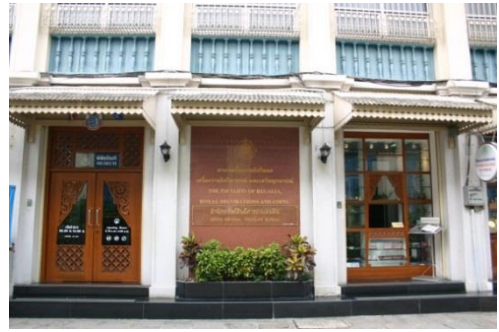
ภาพที่ ๖ ศาลาเครื่องราชอิสริยยศ เครื่องราชอิสริยาภรณ์ และเหรียญกษาปณ์

อีกทั้งศาลาเครื่องราชอิสริยยศ เครื่องราชอิสริยาภรณ์ และเหรียญกษาปณ์ ซึ่งเป็นพิพิธภัณฑ์ที่อยู่ในความดูแลของ กรมธนารักษ์ โดยจัดแสดงเหรียญกษาปณ์ไทยและเงินตราโบราณ เปิดให้เข้าชมมาตั้งแต่ พ.ศ. ๒๕๑๙ มีพื้นที่คับแคบ ไม่สามารถรองรับนักท่องเที่ยวชาวไทยและชาวต่างประเทศที่เข้าชมการจัดแสดงเป็นจำนวนมาก กรมธนารักษ์จึงได้จัดทำ “โครงการก่อสร้างอาคารพิพิธภัณฑ์แสดงเหรียญกษาปณ์และจำหน่ายจ่ายแลกเหรียญกษาปณ์ “ศาลาธนารักษ์” ขึ้น ในพื้นที่บริเวณ กรมสรรพากรเดิม