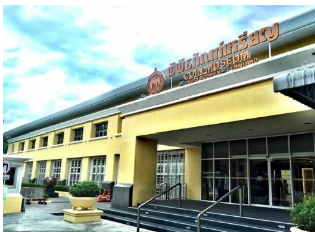
ภาพที่ ๙ อาคารพิพิธภัณฑ์เหรียญ

การออกแบบพิพิธภัณฑ์และรูปแบบการจัดแสดงภายในพิพิธภัณฑ์นั้น กรมธนารักษ์ได้ตระหนักถึงความสำคัญผู้เข้าชมทุกคน ทุกเพศ ทุกวัย ทุกสภาพร่างกาย ทั้งผู้สูงอายุ ผู้พิการ จึงได้นำแนวคิดอารยสถาปัตย์ (Universal Design) มาใช้ประกอบการออกแบบพิพิธภัณฑ์ เช่น พื้นที่ห้องจัดแสดงกว้างเพียงพอสำหรับผู้ใช้รถเข็น คำบรรยายอักษรเบรลล์ แบบจำลองที่สามารถสัมผัสได้สำหรับผู้พิการทางสายตา ระดับความสูงของวัตถุจัดแสดง รวมถึงสิ่งอำนวยความสะดวกต่าง ๆ