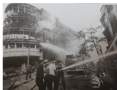
ภาพที่ ๓ อาคารกรมสรรพากรได้รับความเสียหายจากเกิดเหตุการณ์ชุมนุมทางการเมือง

ในวันที่ ๑๗ - ๒๑ พฤษภาคม ๒๕๓๕ บริเวณท้องสนามหลวงและถนนราชดำเนิน เกิดเหตุการณ์ชุมนุมทางการเมือง (พฤษภาทมิฬ) เป็นเหตุให้อาคารกรมสรรพากรและกรมประชาสัมพันธ์ เกิดเพลิงไหม้ ชำรุดเสียหายไม่อาจใช้งานได้ คณะรัฐมนตรีจึงได้มีมติเมื่อวันที่ ๒๙ มิถุนายน ๒๕๓๕ ให้พัฒนาพื้นที่บริเวณดังกล่าว