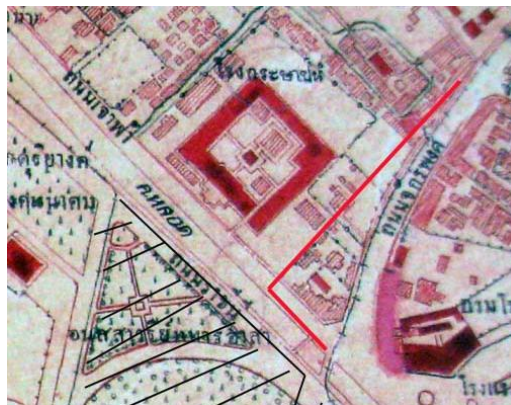
ภาพที่ ๑ แผนที่โรงกษาปณ์สิทธิการ

พิพิธภัณฑ์เหรียญตั้งอยู่ในพื้นที่บริเวณมณฑลนครราชสีมาซึ่งเชื่อมกับถนนเจ้าฟ้า แขวงชนะสงคราม เขตพระนคร เดิมเป็นที่ตั้งของวังพระองค์เจ้าภูมรินทร์ สร้างเมื่อพ.ศ. ๒๓๕๒ อยู่ในกลุ่มวังสะพานเสี้ยวริมคลองหลอด เป็นที่ประทับของพระองค์เจ้าภูมรินทร์ พระองค์เจ้านุชนารถในกรมพระราชวังบวรมหาดิศัยพลเสพย์ และ พระราชวรวงศ์เธอ กรมหมื่นชาญไชยบวรยศ พระราชโอรสในกรมพระราชวังบวรวิไชยชาญ ๑ ซึ่งในรัชกาลพระบาทสมเด็จพระจุลจอมเกล้าเจ้าอยู่หัว ทรงพระกรุณาโปรดเกล้าฯ ให้สร้างโรงกษาปณ์สิทธิการขึ้นในบริเวณที่ดินกลุ่มวังสะพานเสี้ยว ให้เป็นโรงกษาปณ์แห่งที่ ๓ ของประเทศไทย เพื่อรองรับการขยายตัวของการผลิตเหรียญกษาปณ์ด้วยเครื่องจักรไฟฟ้า โรงกษาปณ์แห่งนี้เปิดทำการเมื่อวันที่ ๔ กุมภาพันธ์ ๒๔๔๕ และดำเนินการผลิตเหรียญกษาปณ์มาจนถึง พ.ศ. ๒๕๑๕ เป็นเวลา ๗๐ ปี และในวันที่ ๑๙ กันยายน ๒๕๑๗ กรมธนารักษ์ได้ส่งมอบพื้นที่เฉพาะส่วนโรงกษาปณ์สิทธิการแห่งนี้ มีเนื้อที่ประมาณ ๓ ไร่ ๒ งาน ๑๗ ตารางวาให้แก่กรมศิลปากร เพื่อปรับปรุงเป็นหอศิลป์แห่งชาติ (พิพิธภัณฑ์สถานแห่งชาติ หอศิลป์)